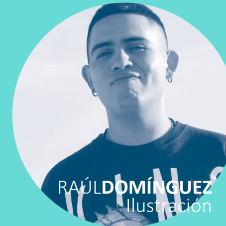
RAÚL DOMÍNGUEZ Ilustración

✉ rauldmgz@hotmail.com Bē hores f Raul Rodrigo Domínguez