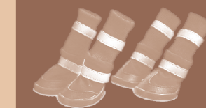
BOTAS PARA CLIMA EXTREMO PETCO.COM