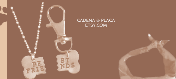
CADENA & PLACA ETSY.COM