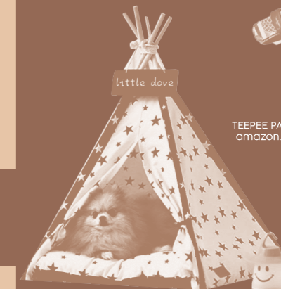
TEEPEE PARA PERROS Y GATOS amazon.com.mx/little-dove